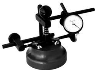
VCG-M Прибор для проверки биения клапанов Цена 195 USD.