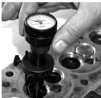
CGVS-M Прибор для проверки concentричности седла клапана микрометрический. Цена 185 USD.