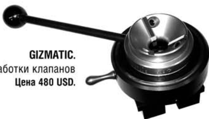
GZIMATIC. Специнструмент точной обработки клапанов Цена 480 USD.